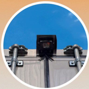
CÁMARA DE REVERSA