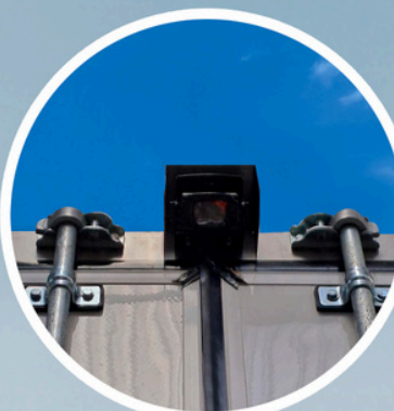
CÁMARA DE REVERSA